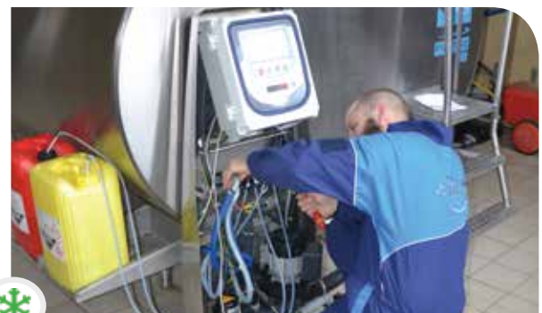
Photo ci-dessus: construction d'une cuve agitée et thermo-régulée pour l'agroalimentaire, dans notre établissement d'Ozan près de Mâcon (01).

SERAP développe des cuves techniques et des équipements «clé en main» pour les industries pharmaceutiques, cosmétiques et agro-alimentaires, adaptés à leurs procédés de fabrication.